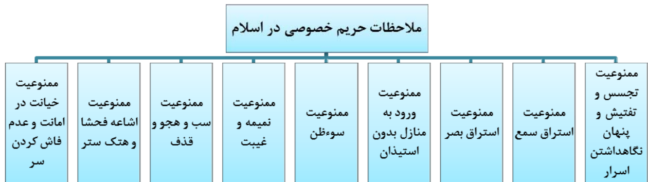
شکل ۲: ملاحظات حریم خصوصی در اسلام

دین مقدس اسلام به عنوان کامل ترین ادیان الهی، توجه ویژه ای به موضوعات مرتبط با حریم خصوصی دارد. در کتاب و سنت به وفور به این موضوع اشاره شده است. شکل ۲ ملاحظات حریم خصوصی در اسلام را نشان می دهد. به طور کلی می توان دستورات اسلام را در این زمینه به چند دسته تقسیم نمود (اسکندری، ۱۳۸۹، و انصاری، ۱۳۸۶، و شاه علی، ۱۳۸۸):