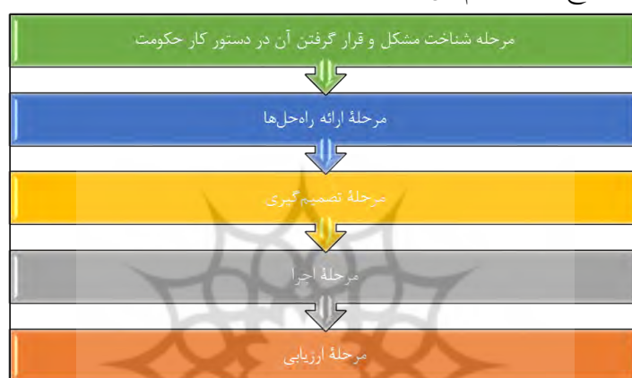
نمودار شماره ۱- پنج مرحله سیاست‌گذاری از نظر جونز

مدل مرحله‌ای چارلز جونز در سیاستگذاری با قرار دادن اعمال تصمیم‌گیران و مسئولان حکومتی در مرکز توجهات خود، نگاه متفاوتی به مسائل عمومی از جمله معضلات زیست محیطی دارد. کاربرد مدل مزبور که برای نخستین بار چارلز جونز، استاد آمریکایی علوم سیاسی، آن را ارائه کرد، بعدها از سوی دیگر کارشناسان سیاست‌گذاری عمومی توسعه پیدا کرد (وحید، ۱۳۸۰: ۲۱۸). در مدل جونز، عملکرد دولت و تصمیم‌گیران در بخشهای اصلی حکومت، به پنج مرحله به هم وابسته به شرح زیر تقسیم می‌شوند: