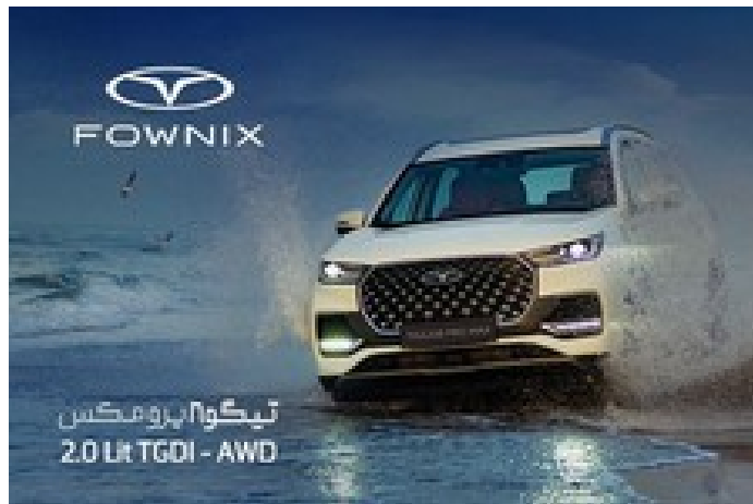
لذت طبیعت گردی با دو دیفرانسیل هوشمند و موتور ۲ لیتری تیگو ۸ پرو مکس