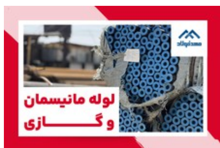
فروش انواع لوله مانیسماں، گازی و لوله داربستی