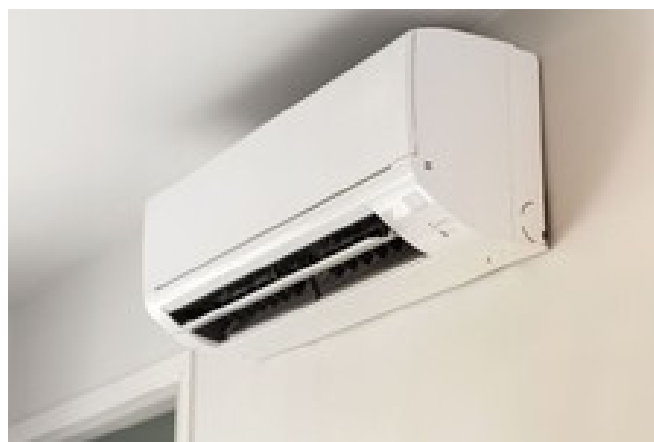
کولر ترو «قسطی» نوکن | با مناسبترین قیمت برای تابستون کولر بخر