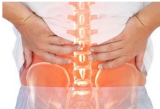
دیگه با درد کمر خداحافظی کن | درمان 30 روزه با پلاتینر!