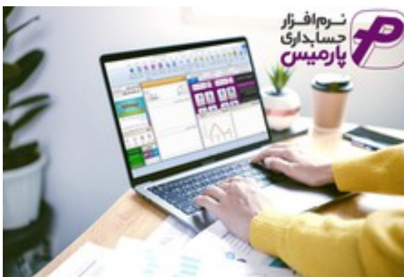
وقت حرفه ای شده، به نرم افزار حسابداری هوشمند داشته باش!