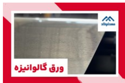
انواع ورق گالوانیزه، روغنی و رنگی به قیمت روز