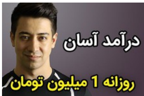
بدون سرمایه ساعتی 42 هزار تومان درآمد داشته باش!