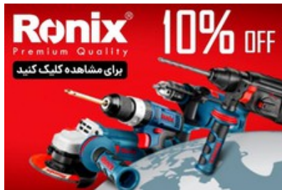
خرید ابزار رونیکس با 10% تخفیف بیشتر!