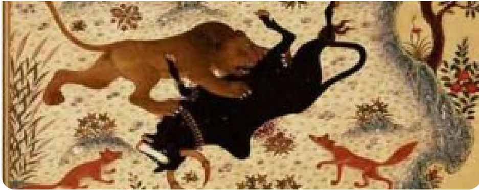
پژوهش‌های اخلاق فارسی راه‌یافته به نگاشته‌های اخلاقی قرن چهارم (دنیای اسلام)