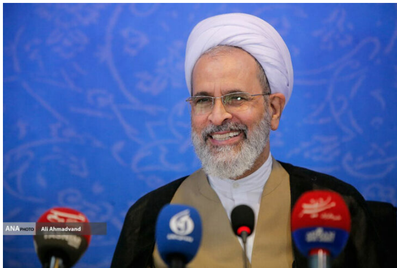
معرفی آیت الله علیرضا اعرافی

هر رشته سیاست‌ها و استراتژی‌هایی خاص به خود را دارد. تأکید بر یادگیری مباحث فقهی و ارتباط آن با مباحث تعلیم و تربیت به منظور اجتهاد و استنباط مسائل فقهی و تأکید بر فراگیری مسائل، روش‌ها، مبانی، نظریات علوم تربیتی موجود و موضوع شناسی در این رشته از سیاست‌های راهبردی در فقه تربیتی است. همچنین تأکید بر آموزش و پژوهش در همه مراحل و به طور خاص پژوهش همراه با تولید، همچنین ارتباط با مجامع علمی مانند دانشگاه و دیگر مؤسسات پژوهشی و ارتباط با نهادهای اجرایی از دیگر سیاست‌های تأسیس فقه تربیتی است. تأکید بر ارتقای شخصیت اخلاقی و معنوی دانش پژوهان در طول دوره تحصیل و پرورش متخصصان در این راستا نیز از اهدافی است که به این موضوع کمک بسیاری خواهد کرد.